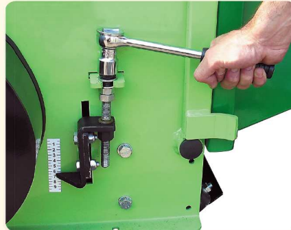
Facile millimetrica regolazione rullo. Easy millimetric roller adjustment. Réglage millimétrique du rouleau arrière. Einfachste, millimetergenaue. Höheneinstellung der Stützrolle.