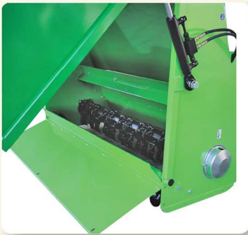
Apertura porta interna per facile ispezione e manutenzione Inner door for quick inspection and maintenance Porte intérieure pour une inspection et maintenance rapides Innen-Klappe für Kontrollen und Pflege

Der PANTHER MULTIFIT mit hydraulischer Bodenentleerung wird zum Mähen und VERTIKUTIEREN mit gleichzeitiger Aufnahme in einen Sammelbehälter eingesetzt. Diese Maschine bietet ein exzellentes Feinschnitt-Ergebnis, gleichzeitiges Vertikutieren, sowie perfekte Aufnahme in einem Arbeitsgang und damit Reinigung der bearbeiteten Flächen. Die Maschine ist ideal zum Einsatz auf kommunalen Flächen und Sportplätzen geeignet. Einfache Transport mit hinten Rädern, für Traktoren mit 30PS