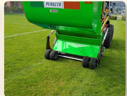
Manutenzione professionale. Professional maintenance. L'entretien professionnel. Professionelle Wartung.