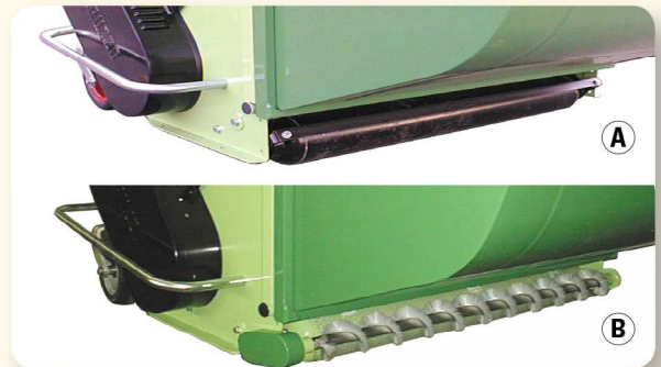
Pulitura rullo con barra raschiatutto (A) o con spazzola per superfici sportive (B) Roller cleaning with scraping metal bar (A) or with brush for sport courses (B). Nettoyage du rouleau avec racleur (A) ou brosse pour terrains de sport (B). Reinigung der Heck-Stützwalze über Stahl-Abstreifer (A) oder mit Bürste für Sportplatzeinsatz (B).